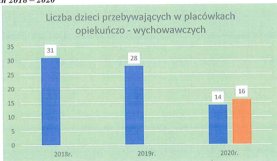
Wykres 3. Liczba dzieci przebywających w placówkach opiekuńczo - wychowawczych w latach 2018 – 2020