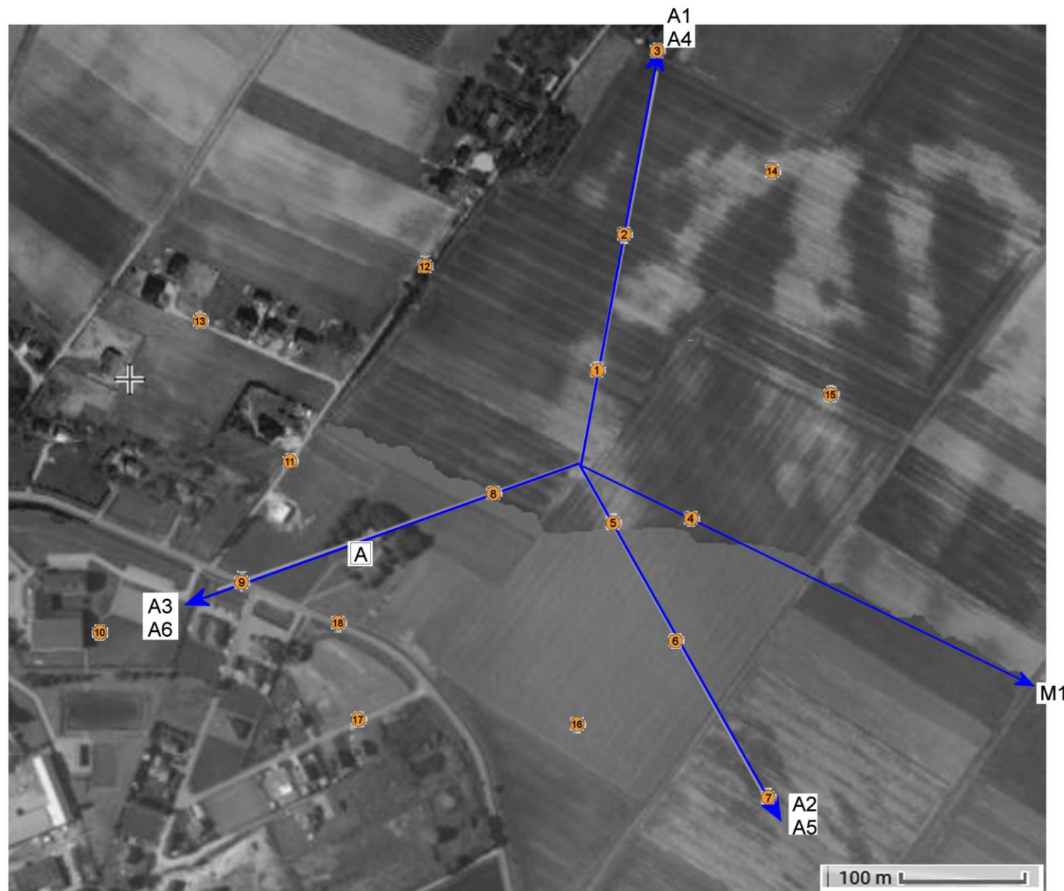
A Rożwienica 4