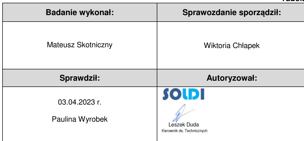
Tabela nr 6

Stwierdzenia zgodności dokonano na podstawie zasady podejmowania decyzji i wymagań zawartych w załączniku do Rozporządzenia Ministra Klimatu z dnia 17 lutego 2020 r. w sprawie sposobów sprawdzania dotrzymania dopuszczalnych poziomów pól elektromagnetycznych w środowisku [Dz. U. z 2022 r. poz. 2630].