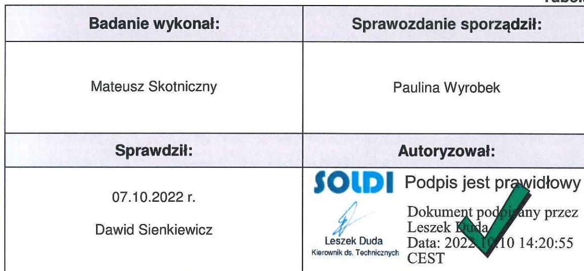
Tabela nr 6

Stwierdzenia zgodności dokonano na podstawie zasady podejmowania decyzji i wymagań zawartych w załączniku do Rozporządzenia Ministra Klimatu z dnia 17 lutego 2020 r. w sprawie sposobów sprawdzania dotrzymania dopuszczalnych poziomów pól elektromagnetycznych w środowisku [Dz. U. 2020, poz. 258, Dz. U. 2022, poz. 1121].